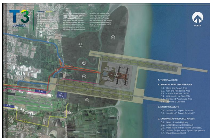
Gambar 4. Maket Terminal-3 Juanda + double runway

Rencana reklamasi yang mulai diinisiasi oleh Pemerintah Propinsi Jawa Timur dan PT. Angkasa Pura 1 Juanda Surabaya di Sidoarjo sejak awal tahun 2013. Pesisir Pantai Timur Sidoarjo (Sedati) ini rencananya akan dikembangkan sebagai Airport City (Kota Bandara) dimana didalamnya terdapat kawasan perdagangan dan pariwisata, fasilitas yang rencana akan dibangun dari kegiatan reklamasi tersebut meliputi perkantoran, pergudangan, pusat perdagangan/ bisnis, pusat perbelanjaan/ mall, pusat kebugaran, hotel dan restoran, sekolah internasional, rumah sakit bandara, tempat pariwisata, dan darmaga. Keterbatasan lahan di wilayah Sidoarjo, terutama di wilayah timur yaitu di sekitar pesisir timur Sedati ini ingin dikelola melalui kontribusi pembangunan di sektor perekonomian/ perdagangan dan pariwisata (lihat Gambar 4).