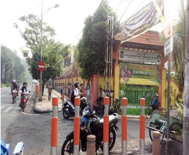
Gambar 1. SDN Margorejo I/403

dari hasil penelitian ini dapat menjadi dasar dalam perencanaan lalu lintas atau perencanaan bangunan sehingga dapat meminimalkan permasalahan. Serta dapat menjadikan dasar untuk menghasilkan alternatif solusi dari permasalahan yang ada sesuai dengan karakteristik daerah tersebut.