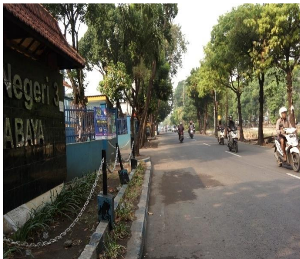
Gambar 3. SMKN 3 Surabaya