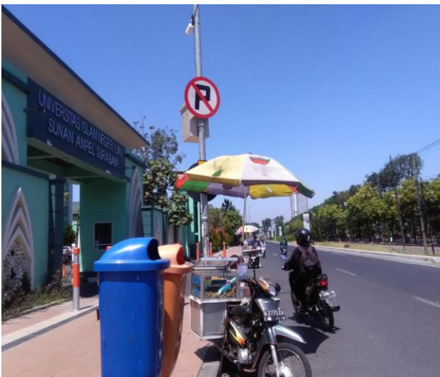
Gambar 2. Kampus UIN Sunan Ampel Surabaya